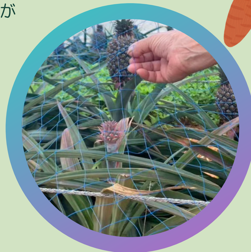
沖縄県 南国フルーツを栽培される農家さん