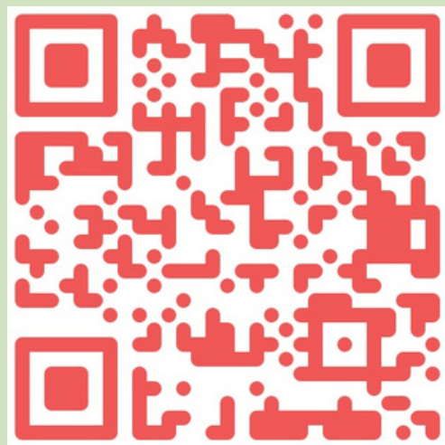
会社ホームページQR

お問い合わせ： https://cranelover.lovepop.jp/contact/